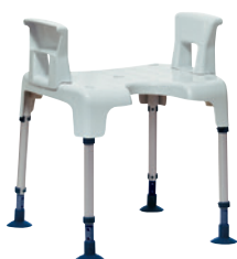
Banco de duche Pico com apoios de braços