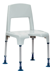
Cadeira de duche Pico com os apoios de braços desmontados