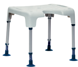
Banco de duche Pico