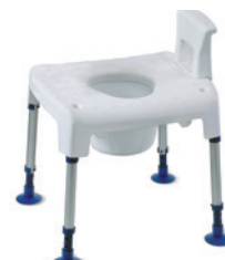
Cadeira Aquatec Pico 3 em 1 com o encosto e 1 dos apoios de braço desmontados.