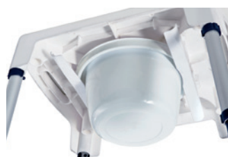
Cadeira Aquatec Pico 3 em 1 - A aparadeira é facilmente amovível (por trás, pela frente e lateralmente)